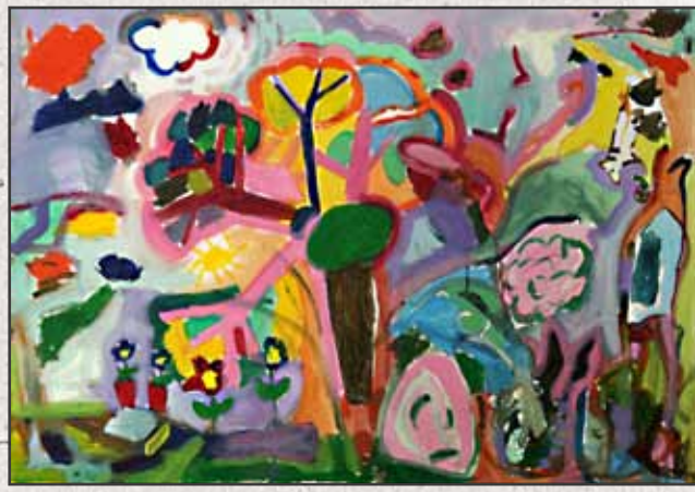
Kerek erdő II, 2011, 70x100cm, akril, vászon