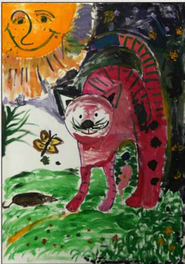
Lila macska, 2011, 100x70cm, akril, vászon