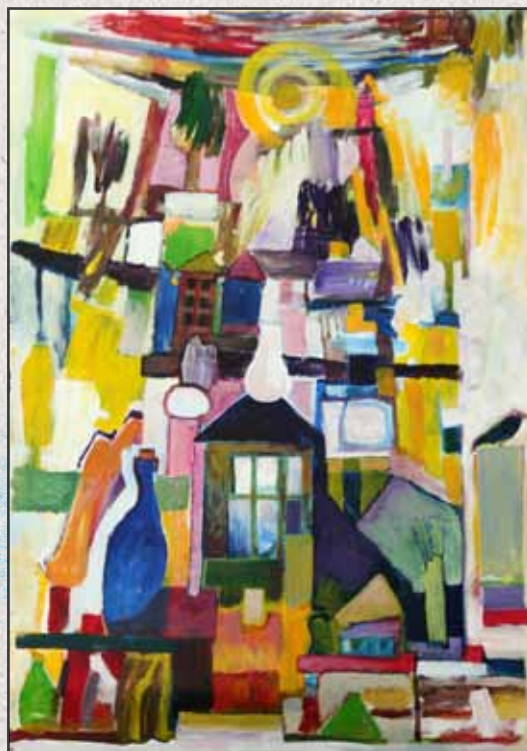
Az ajtó, 2011, 100x70cm, akril, vászon