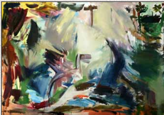
Papageno, 2011, 70x100, akril, vászon