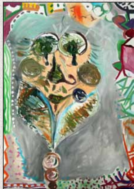
Arc, 2011, 100x70cm, akril, vászon