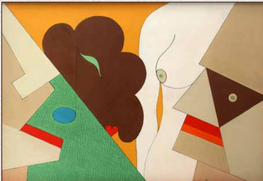
Zenés beszélgetés a nőkről, 2009, 70x100cm, olaj, farost