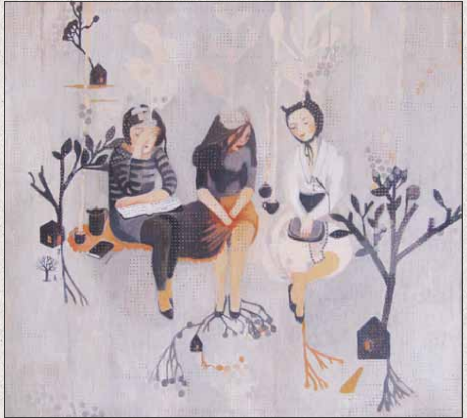
Három nő-értelem, érzékenység, hiúság, 2011, 62x68cm, olaj, vászon

”Tanulmányait a Moholy-Nagy Művészeti Egyetem textiltervező (1996-2002), valamint vizuális és környezetkultúra szakán (1997-2003) végezte. Már az egyetemen is a képzőművészet foglalkoztatta és ösztöndíját a római Accademia Di Belle Arti festő szakán végezte. Évekig tanított vizuális kultúrát egy művészeti középiskolában. Alkalmazott grafikusként, illusztrátorként is dolgozik. Munkáit kezdettől a festőiség és a pasztelles színvilág jellemzi, melyek helyét fokozatosan a grafikai látásmód és a redukáltabb színhasználat veszi át. Tértől is időtől függetlenül alakok kompozícióiból álló festményei és grafikai a befogadó szabad asszociációs társításaira építenek.”