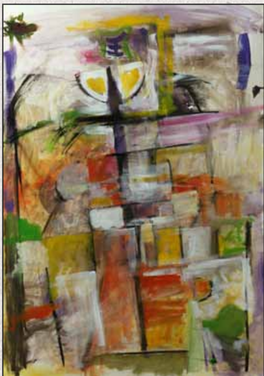
Sárga hőléd, 2011, 100x70cm, akril, vászon