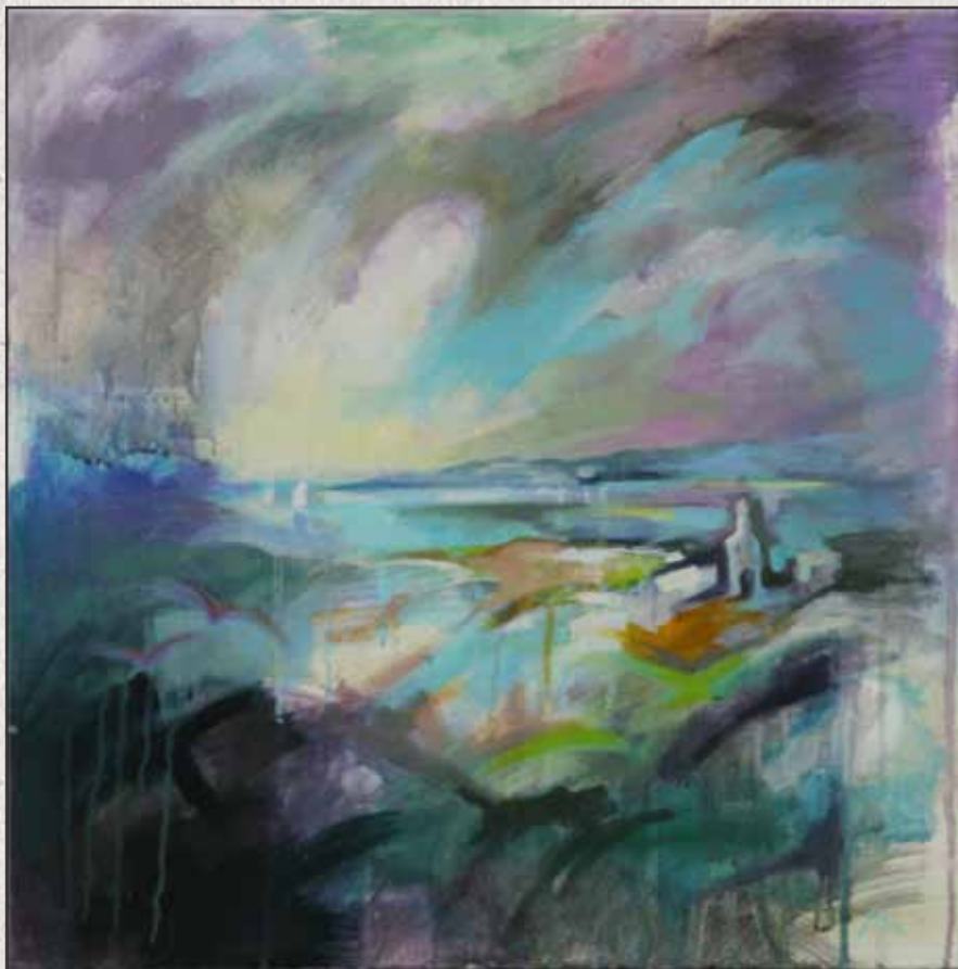
Szín-tér IX, 2011, 55x55cm, akril-vászon

” Bubla Éva művészetében a lényegi elemek, minőségek, értékek, érzések és hangulatok megjelenítési eszköze a szín, és azok kölcsönhatása, játéka. Festésmódja, a lebegő sejtelmesség lírai ábrázolásmódja a lélek rezdüléseinek válik a kifejezőjévé. Ez a fajta látásmód és festésmód főként a befogadó érzelmi és hangulati azonosulására hat, így inkább érezzük ezeket a képeket, minthogy beszélni tudnánk róluk.”