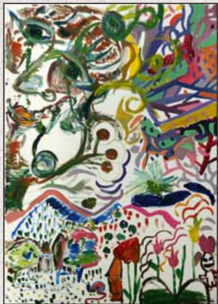
Nyáron a ligetben, 2011, 100x70cm, akril, vászon