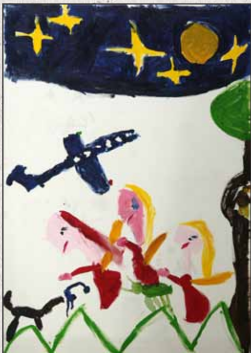
Az éjszaka titkai, 2011, 100x70, akril, vászon