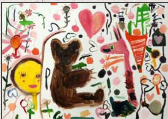
Mackós kép, 2011, 70x100cm, akril, vászon