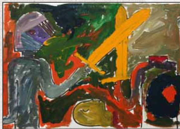
Wahom és a gyerekek I., II., III., IV., V., 2011, 70x100cm, akril, vászon