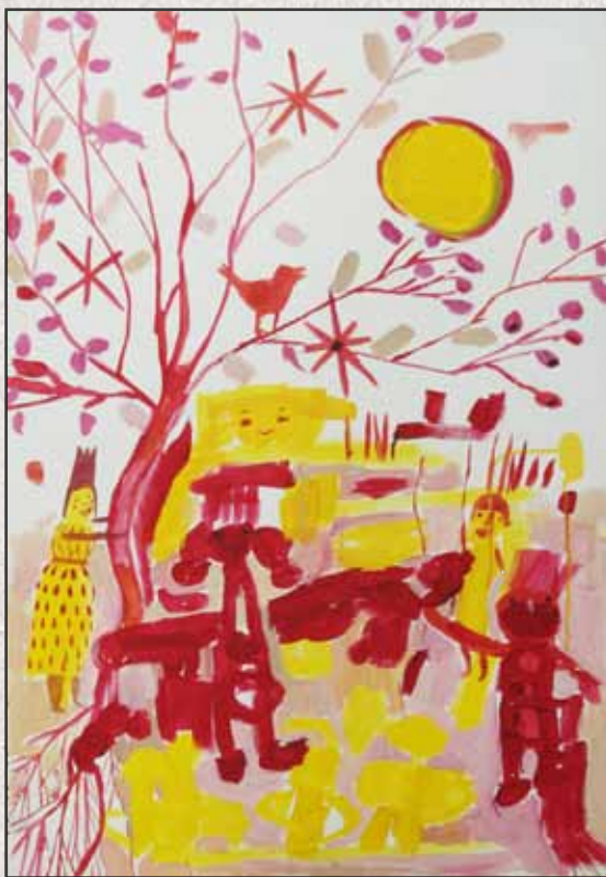
Születés (Tavaszi), 2011, 100x70cm, akril, vászon