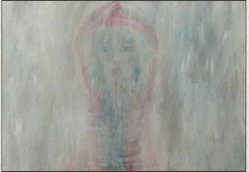
A szemem áthatol, 2009, 70x100cm, akril, vászon

” Mit mondhatunk Horváth Judit képeiről? Életszeretetet sugallnak, amit bizonyos figyelő, szelíd, de erőteljes komolyság hálóz be, adul, mélyen. Nem kedveli ez a látásmód a hivatalos, a hízelgő szépet. Tudja, megismerte, hogy aki szereti az életet, annak föl kell készülnie a drámákra is.