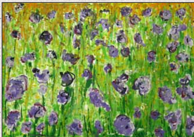
Pipacs mező II, 2011, 70x100cm, akril, vászon