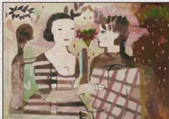
A pillanat, 2011, 70x100cm, akril, vászon