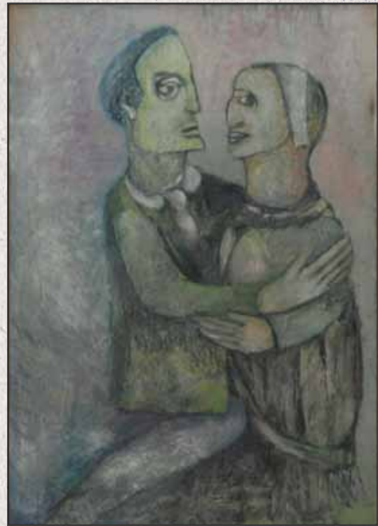
Tánc, 2009, 100x70cm, olaj, papír

”...Tóth Józsi 1988-92: a Rippl-Rónai Stúdió meghatározó alakja, majd 1996-tól MAOE - Magyar Alkotóművészek Országos Egyesületének a tagja.