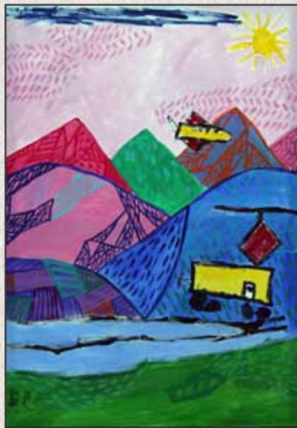
A sárga villamos, 2011, 100x70cm, akril, vászon