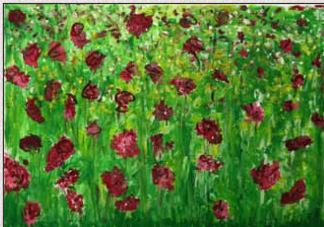
Pipacs mező I, 2011, 70x100cm, akril, vászon