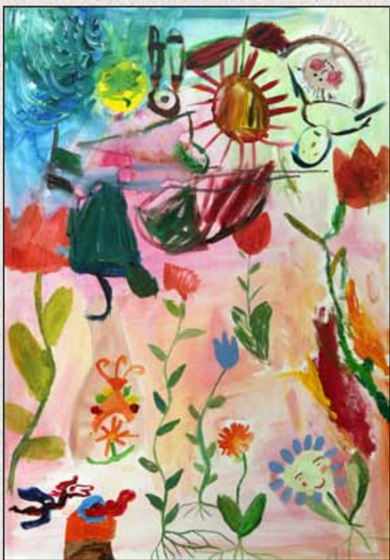
Kertem, 2011, 100x70cm, akril, vászon