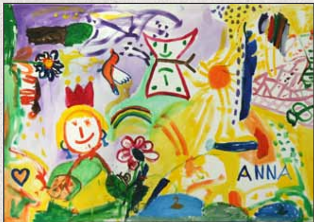
Kerek erdő I, 2011, 70x100cm, akril, vászon