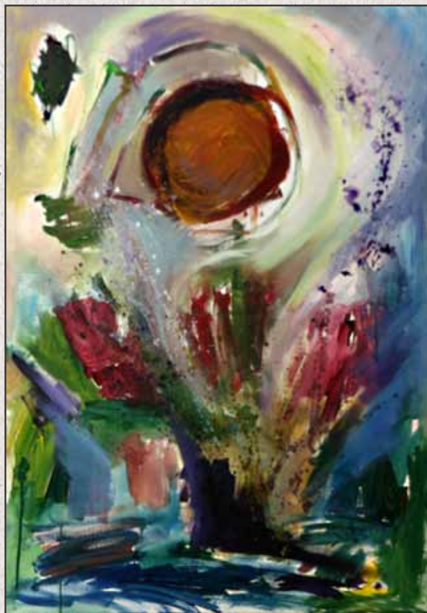
Csodabogyó, 2011, 100x70, akril, vászon